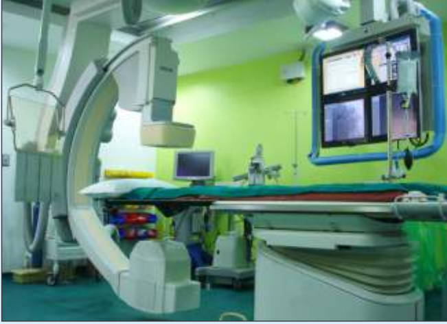
એન્જિયોપ્લાસ્ટીના શ્રેષ્ઠ પરિણામો માટે સ્ટેન્ટ બુસ્ટ ટેકનોલોજીથી સુસજ્જ વિશ્વસનું સૌથી ઝડપી એન્જિયોગ્રાફી મશીન સીમ્સમાં.