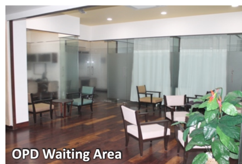
OPD Waiting Area

flexibility to deliver conventional therapies to treat a wide range of tumors throughout the body, while also enabling treatment of highly complex cancers that require extreme targeting precision. With this ground breaking combination, clinicians can now, for the first time, take full