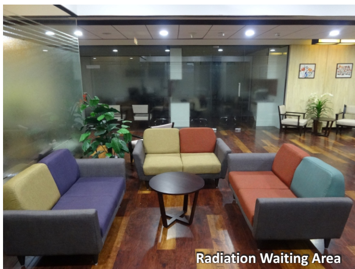
Radiation Waiting Area

flexibility to deliver conventional therapies to treat a wide range of tumors throughout the body, while also enabling treatment of highly complex cancers that require extreme targeting precision. With this ground breaking combination, clinicians can now, for the first time, take full