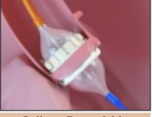
Balloon Expandable Valve