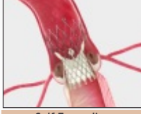
Self Expanding Supra-Annular Valve

A procedure to replace the diseased valve without surgery