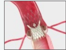
Self Expanding Supra-Annular Valve

A procedure to replace the diseased valve without surgery