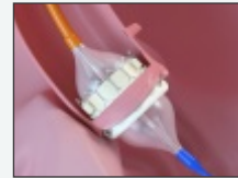
Balloon Expandable Valve