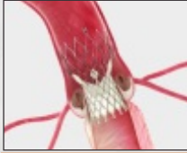
Self Expanding Supra-Annular Valve (TAVR)