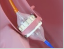
Balloon Expandable Valve (TAVR)

(Transcatheter Aortic Valve Replacement - TAVR / Transcatheter Mitral Valve Replacement - TMVR-ViV)