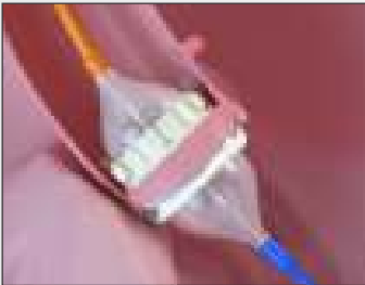
Balloon Expandable Valve