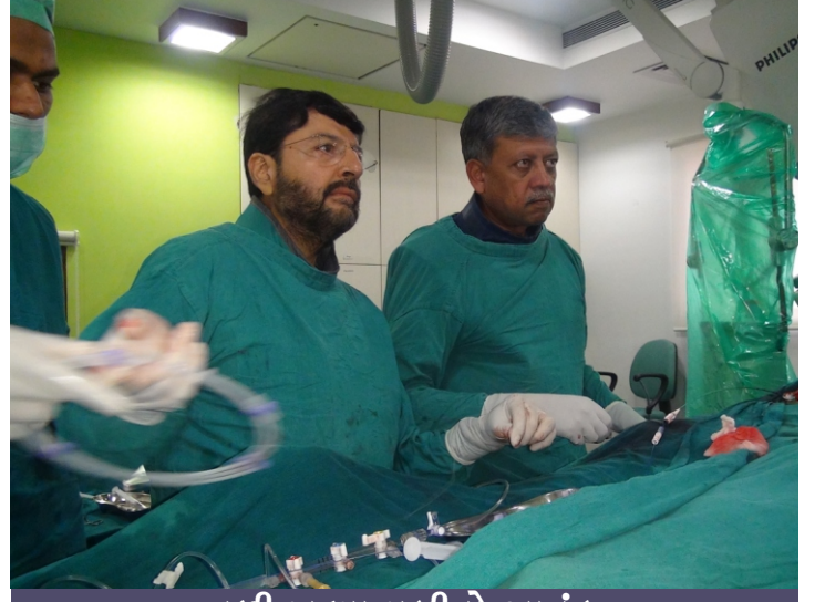
નળી ખૂલ્યા પછીનો આનંદ

શોક હૃદયને ૩૦૦ અને ૩૬૦ એનર્જી સ્તરે અપાયા. મારો દર્દી પડ્યો તેવો તરત જ ઊઠી ગયો. આ પરિસ્થિતિને “સડન કાર્ડિયાક ડેથ” કહે છે. સદ્ભાગ્યે મારી ધમની (જ્યારે હું એન્જિયોગ્રાફી કરું છું ત્યારે હું મારા દર્દીના હૃદય સાથે એટલો બધો સંકળાઈ જાઉં છું કે એ પછી તેના હૃદયને હું “મારું હૃદય” અને તેની ધમનીઓને “મારી” ધમનીઓ કહું છું.) હજુ પણ ખુલ્લી હતી. ધીરે ધીરે તેને સુધારો આવવા લાગ્યો. તેને ક્રિટિકલ કેર યુનિટમાં લઈ જવાયો. હું તેને બચાવીને ખૂબ જ ખુશ હતો. તેની પત્ની આંખોમાં આંસુ સાથે મને ભેટી પડી.