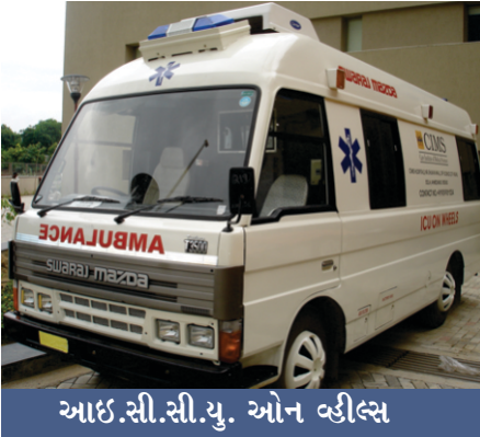
આઈ.સી.સી.યુ. ઓન વ્હીલ્સ