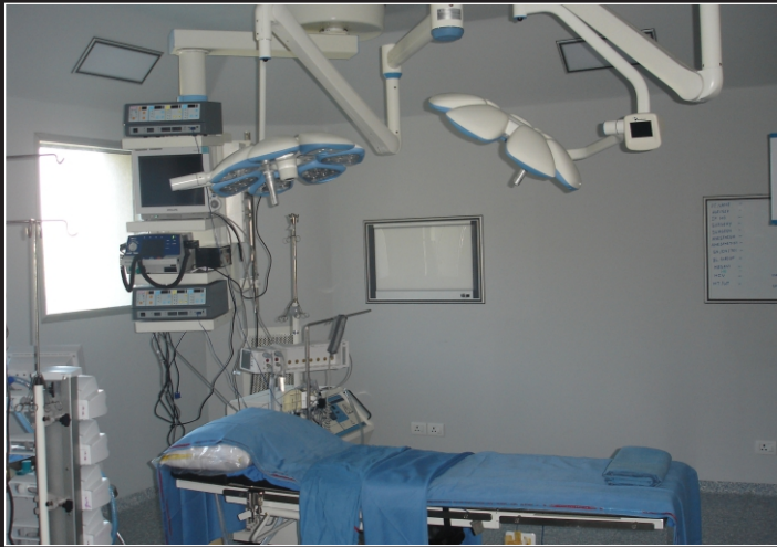
भोड्युलर ओपरेसन थियेटर/मॉड्युलर ऑपरेसन थियेटर