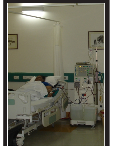
डायालीसीस सेन्टर/ डायालीसीस सेन्टर