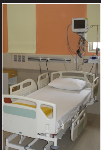
धलेक्ट्रीक ट्रोली बेड/ इलेक्ट्रीक ट्रोली बेड