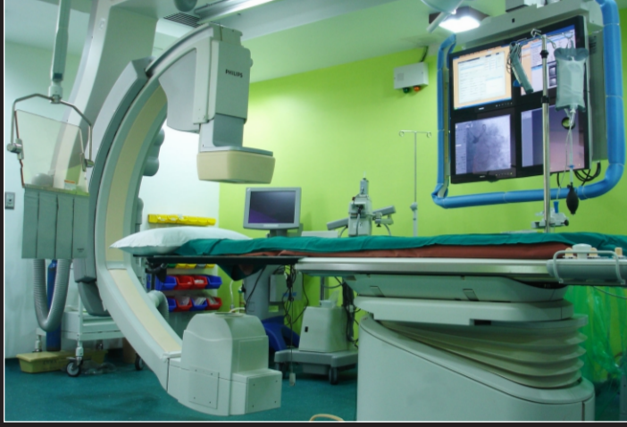
डिविप्स एक्सपर मशीनमा इक्त ५ सेकन्डमा अन्वियोगाशीना थाय छे फिलिप्स एक्सपर मशीनमें सिर्फ 5 सेकन्डमें एन्डियोग्राफी होती है