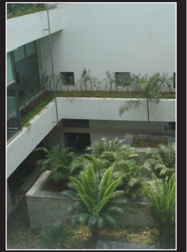
कर्टयार्ड गार्डन/कर्टयार्ड गार्डन