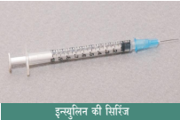
इन्सुलिन की सिरिंज

डायबिटीज़ के इलाज का प्रथम लक्ष्य रक्त में शर्करा की मात्रा को निर्धारित सीमा तक लाना है। धऊशरआ लक्ष्य महत्वपूर्ण अवयवों