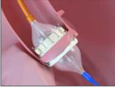
Balloon Expandable Valve

(ट्रान्सकेथेटर ओओर्टिक वाल्व इम्प्लान्टेशन)