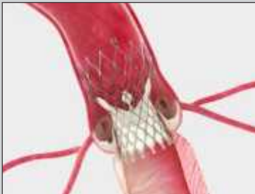
Self Expanding Supra-Annular Valve

सर्जरी के बिना रोगग्रस्त वाल्व को बदलने की प्रक्रिया