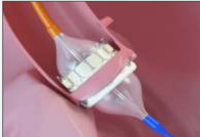
Balloon Expandable Valve

ट्रान्सकेथेटर अेओर्टीक वाल्व ईम्प्लान्टेशन