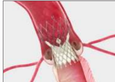
Self Expanding Supra-Annular Valve

सर्जरी के बिना रोगग्रस्त वाल्व को बदलने की प्रक्रिया