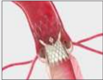
Self Expanding Supra-Annular Valve