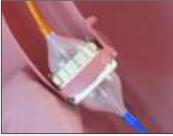
Balloon Expandable Valve