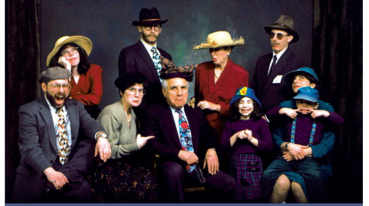
परिवार में सबको हृदयरोग

हृदयरोग आजकल छोटी उम्र के लोगों को भी अपना शिकार बनाने लगा है, ऐसी माना जाता है कि सन २०१५ तक भारत में होने वाली मृत्यु में से एक तिहाई मृत्यु हृदयरोग के कारण होंगी। २०२०