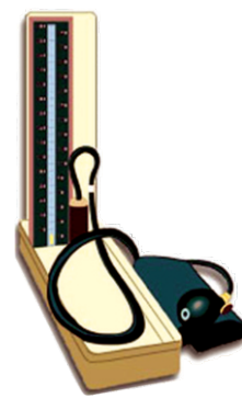
बी.पी. पर काबू रखें

हृदयरोग के हमले से होने वाली मृत्यु को टाला जा सकने वाला सबसे बड़ा कोई कारण है तो वो है तम्बाकु का किसी भी रूप में सेवन। तम्बाकु के धुंए में निकोटिन और कार्बन मोनोक्साइड मानव शरीर में ऑक्सीजन की मात्रा को कम करती है। वह रक्तवाहिनियों की दीवारों को भी चोट पहुंचाती हैं और चरबी की परत जमने का भी कारण बनती है। तम्बाकु के धुंए से रक्त भी जम जाता है। धूम्रपान करने से एच.डी.एल. (अच्छा) कोलेस्ट्रॉल कम होता है, जिसके कारण हृदयरोग का हमला व लकवे का खतरा बढ़ जाता है। दूसरे लोग धूम्रपान करते हों उसका धुंआ सांस में जाने के कारण धूम्रपान नहीं करने वाले लोगो में भी हृदयरोग के हमले का खतरा बढ़ जाता