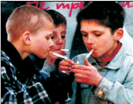
कम उम्र में व्यसन

कृपया याद रखें कि तम्बाकु किसी भी स्वरूप या मात्रा में हानिकारक है, फिर भले ही वो नसवार की तरह सूंघने में आए या दाँत घिसने के पेस्ट के रूप में, पान - मसाले के साथ चबाने के, या धूम्रपान करने में आए। बीड़ी, सिगरेट, चिलम या सिगार, सब कुछ हानिकारक हैं। धूम्रपान का कोई भी