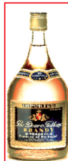
शराब नहीं के बरोबर लें