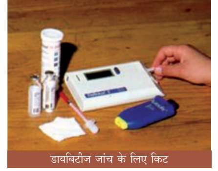
डायबिटीज जांच के लिए किट

का कदाचित कई सालों तक पता भी ना चले, परंतु इस कारण कई गंभीर समस्याएं भी आ सकती हैं, जैसे कि हृदय और रक्तवाहिनियों के रोग और हृदयरोग का शांत हमला