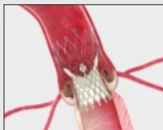
Self Expanding Supra-Annular Valve

A procedure to replace the diseased valve without surgery