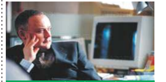
बायपास के बाद धीरे - धीरे काम की शुरुआत

आने वाले दिनों, सप्ताह, व महिनों में दर्द धीरे - धीरे कम होता है और खांसी बंद हो जाती है। छाती, हाथ व पैर के उपर शल्यक्रिया को घाव शल्यक्रिया के तीन से चार सप्ताह में कम होने लगते हैं।