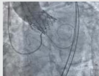
Balloon Inflatable (Hybrid) Myvalv

(ट्रान्सकैथेटर अेओर्टीक वाल्व इम्प्लान्टेशन)