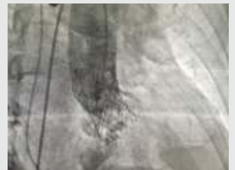
Self Expanding (Supra-Annular) Evolut Valve

सर्जरी बिना रोगग्रस्त वाल्व को बदलने की प्रक्रिया