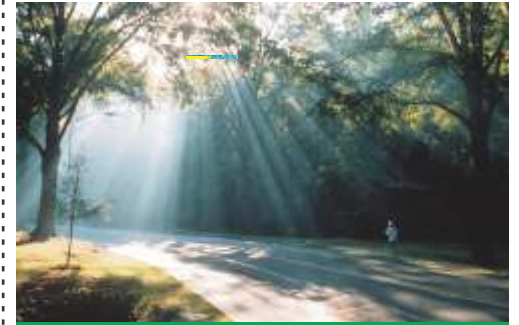
बायपास के बाद नई जिंदगी ... आशा की नई किरणें

यह पुराने, और चुपचाप खत्म करने वाले रोगों को तो जीवन भर काबू में रखना चाहिए ! यह याद रखें कि बायपास से डायबिटीज और हाई ब्लडप्रेसर खत्म नहीं होता। संक्षिप्त में, हृदय की बड़ी शल्यक्रिया के बाद रोगी की यथायोग्य देखभाल सबसे महत्वपूर्ण है।