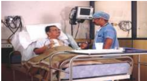
२ - ३ दिनों में रोगी बैठकर बात करता है

भी भयानक, खतरनाक, और जाटि ला माना जाता है। पर असल में ऐसा नहीं है, वास्तव में यह एक सुरक्षित प्रक्रिया (procedure) है। बहुत कम लोग जानते हैं कि सामान्यतया बायपास में १ से २ प्रतिशत तक ही खतरा है, जो अन्य किसी ऑपरेशन जितना ही या उससे भी कम है।