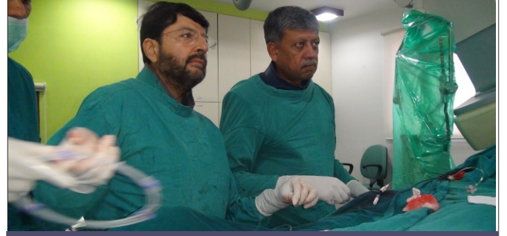
नली खुलने के बाद की खुशी

इस तरह, इस किस्से में मैंने धमनी को सफलतापूर्वक खोलने के लिए तात्कालिक एन्जियोप्लास्टी की और रोगी केवल तीन दिनों में घर चला गया।