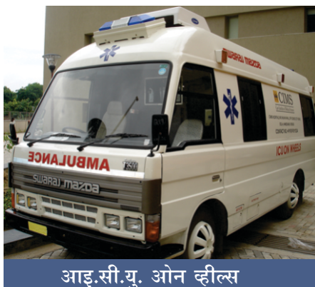
आइ.सी.यु. ओन व्हील्स

आते ही मैंने उनकी जांच की। उनकी छाती में भारीपन था। और पसीना हो रहा था। मैंने स्टेथस्कोप के उपयोग से उनके हृदय को 'सुना'। उनका हृदय बहुत धीरे से धड़क रहा था। मैंने तुरंत ही उनका इलेक्ट्रोकार्डियोग्राम लिया। इ.सी.जी. कागज में दर्शाया जाने वाला एक विद्युतकीय रेकोर्डिंग है। यह हृदय रोग के हमलों का निदान करने का एक अचूक मार्ग है। इ.सी.जी. के द्वारा दिल के दौरे की तीव्रता निश्चित हो गई। मैं रविवार का आराम भूल