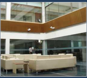
उत्कृष्ट और स्वच्छ पर्यावरण