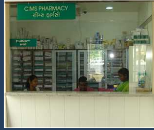
24 x 7 फार्मसी