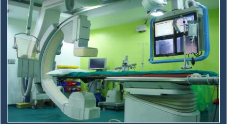
बहु सुविधा और बखूबी सुसज्जित ओ.टी., गहन चिकित्सा कक्ष (आई.सी.यु.) और वॉर्ड