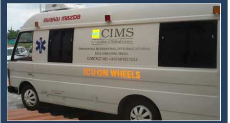
24 x 7 सुसज्जित एम्बुलन्स सेवा (आइसीयु ओन व्हील्स के साथ)