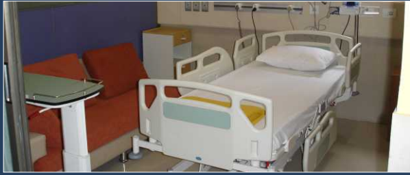
उच्चतम साधन-सामग्रीवाले आरामदायक कमरे