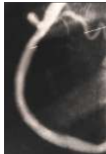
BixVE'EE+EE'OE' E0 EE'nu (EE'U JE'OE'OE' 1/8 VE' EE'EO)

EnuE E0 nEE' EdE EE'EE'EE' EE'EE'EE 1/8E'AE {E'U ME'U EdE EE'EE'EE' <OE'OE'VE. nu'EE VE'EE'EE 1/8=OE'EE EE'nu EdE <+EEVE 3/00E EE'EE'EE' EE'EE' OE'EE OE'EZE E0;U iE'EE E0;UEA 1/8