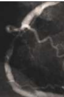
90 EE'EE'EE EE'VE' EE'EO

3/00E 1/8E'E E0 ME'U Eda <x'>OE' E EdE'OE' E'OE'U AE'EE]0 (+E'<OE'OE'OE'OE'U) "Ea +Ea VE'EE VE'EE 1/8 EE'EE' EdE <E'IE'OE' bAC)U E0 UE'OE' E0 ME'< VE'EE' OE' E0 VE'EE' +EEU <OE'OE'VE. O'Ea <+EEVE EE'EE'EE EE'EE'EE 1/8