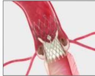
Self Expanding Supra-Annular Valve

સર્જરી વગર રોગગ્રસ્ત વાલ્વને બદલવાની પ્રક્રિયા