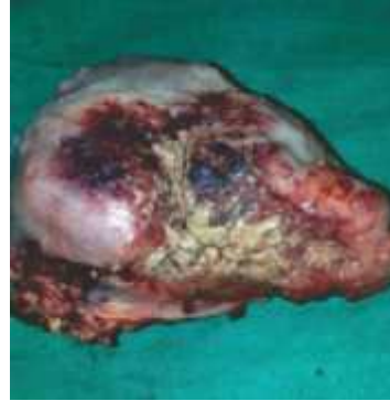
ઓપરેશન દરમિયાન કાઢેલ કેન્સરગ્રસ્ત જીભ

ટૂંકમાં કેન્સરની બિમારીને કારણે શરીર ના ઢાંચામાં ફેરફાર થાય છે. આ ઉપરાંત કેન્સરની સારવારને કારણે પણ શરીરમાં થોડા ઘણા ફેરફાર થાય છે. આ બધા ફેરફારને કારણે દર્દીની Quality of Life માં ફરક પડે છે.જેનો