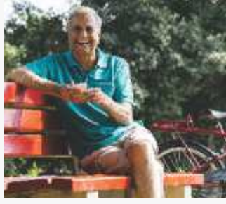
કેન્સર અને શરીર: સારવાર પહેલા અને સારવાર પછી