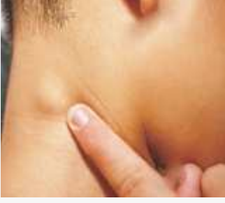
કેન્સર અને સેન્ટીનલ લીમ્ફ નોડ