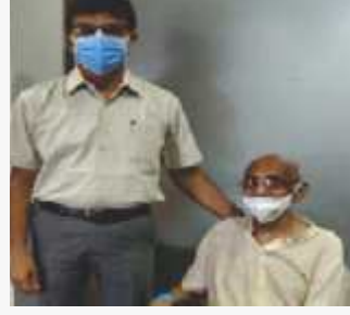
લોહકાઉન ધણાં માટે પ્રેક્ટીકલ બની ગયું