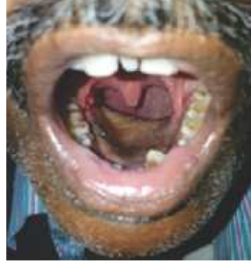
આખી જીભ કાઢ્યા બાદ

ઓપરેશન( સર્જરી ) ની સારવારમાં શરીરમાં જે જગ્યાએ કેન્સર થયું હોય તે ભાગ તથા તેની આજુબાજુનો થોડો ભાગ શરીરમાંથી કાઢવામાં આવે છે. આ ભાગ કેન્સરગ્રસ્ત હોઈ તે શરીર માટે ઉપયોગી નિવડતો નથી અને તેનું કામ પણ ઘણી વખત ઓછું થયું હોય છે. તેવી પરિસ્થિતિમાં જ્યારે શરીરમાંથી આ અંગ દૂર કરવામાં આવેશે