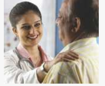
કોરોના અને કેન્સર- મૂલવણના જવાબો