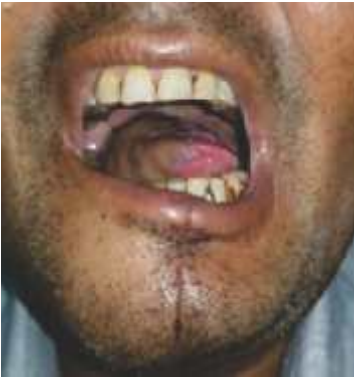
પ્લાસ્ટી સર્જરી પછીની જીભ

કેન્સરની સારવારમાં વપરાતી વિવિધ પદ્ધતિઓમાં ઓપરેશન, રેડિયોથેરાપી અને કિમોથેરાપીનો સમાવેશ થાય છે. આ બધી સારવારને કારણે શરીરમાં અમૂક બદલાવ આવે છે. મોટાભાગના બદલાવ ટૂંકા ગાળાના હોય છે જ્યારે અમુક લાંબા ગાળાના અથવા જીવનભર ના હોય છે.